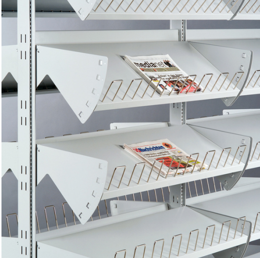
Vinklet tidsskrifthyld 20°-30°-40°-50°-60°