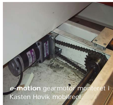
e-motion gearmotor monteret i Kasten Høvik mobilreol.