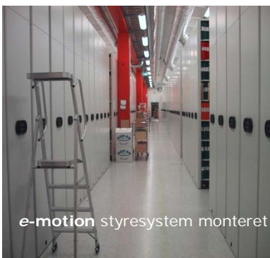
e-motion styresystem monteret