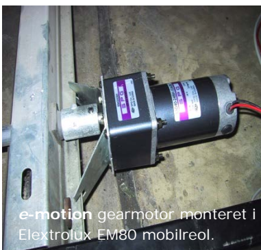
e-motion gearmotor monteret i Electrolux EM80 mobilreol.