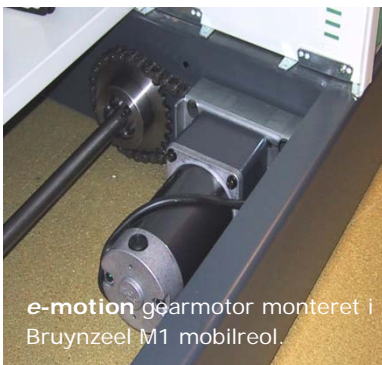
e-motion gearmotor monteret i Bruynzeel M1 mobilreol.